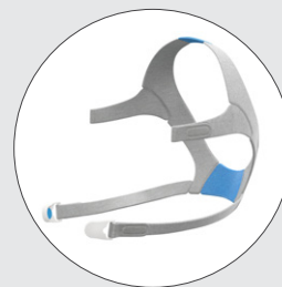
Arnés de la serie AirFit F20 con broches de arnés