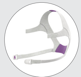
Arnés de la serie AirFit F20 for Her con broches de arnés